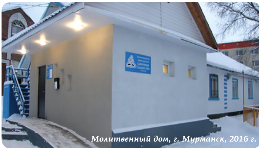
Молитвенный дом, г. Мурманск, 2016 г.

За прошедшие сорок лет, несмотря на трудности и препятствия в суровом климате Заполярья, община сумела вырасти и окрепнуть. Оглядываясь назад, братья и сестры мурманской церкви благодарят Бога за щедрые благословения, которые Он послал им в лице людей, оставивших комфорт и своих родных, людей, приехавших в их город, чтобы темноту полярной ночи атеизма пробил яркий свет истины.