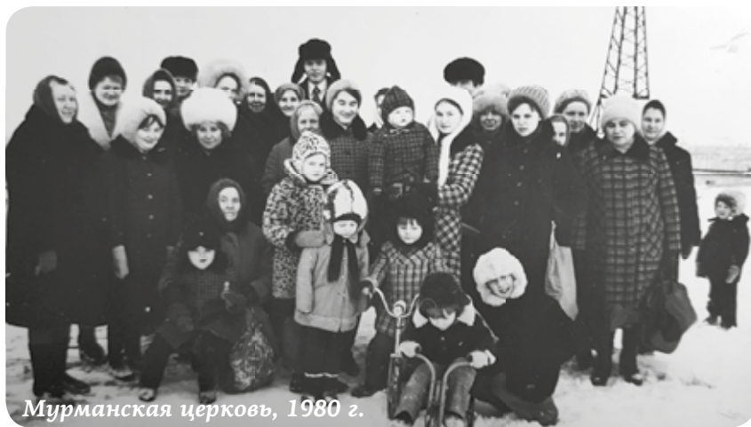
Мурманская церковь, 1980 г.